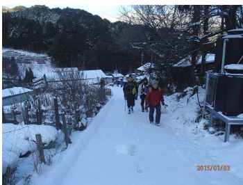
高津集落道から登山口へ