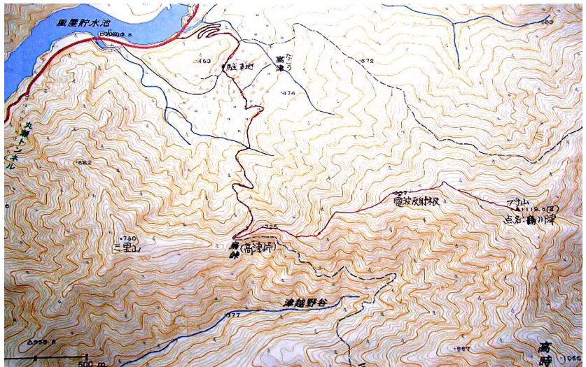
ルート図 (2.5万地形図「風屋」)