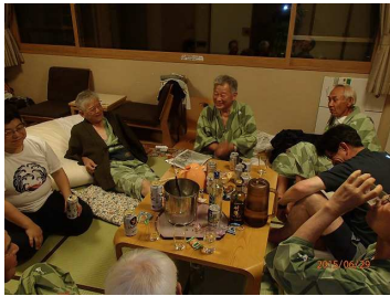
花神楽での夕食懇談