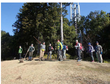
展望台で眺望を楽しむ