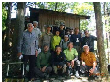
勤行後の記念撮影