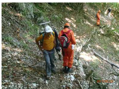
引揚げ捜索隊すれ違う

「遭難者の発見と皆さんの満行を祈念して」と懺悔文、開経偈、般若心經を唱えて下さった。