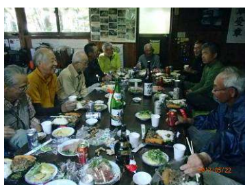
懇親交流会が始まる