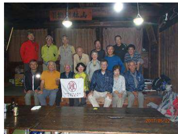
懇親交流会で話はずむ