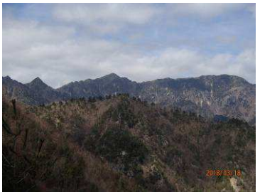
大日岳く釈迦ヶ岳く孔雀岳