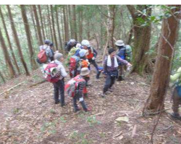
急峻な休場ノ尾根を下る