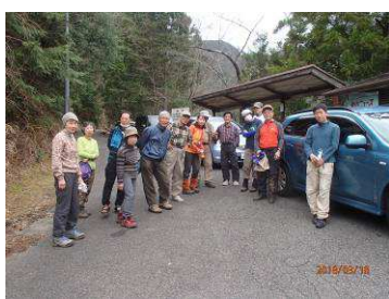
前鬼口バス停で終礼