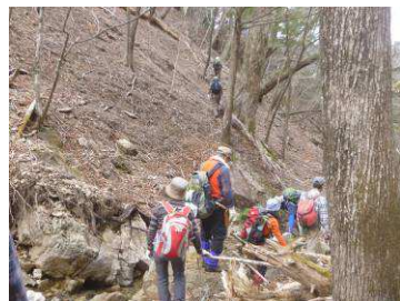
ウリネ谷を渡り斜上