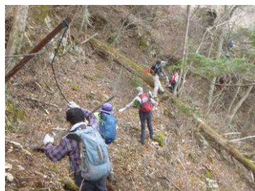
獣除けネット沿いのトラバース道