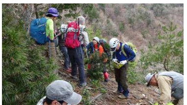
小休止後の出発準備