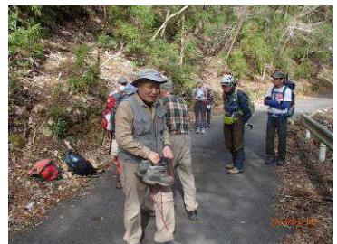
牛抱坂登山口で身支度