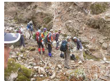
本日の参加者(牛抱峠にて)