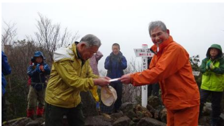
会長よりお祝い贈呈