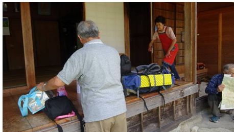
五鬼助さんご夫妻と